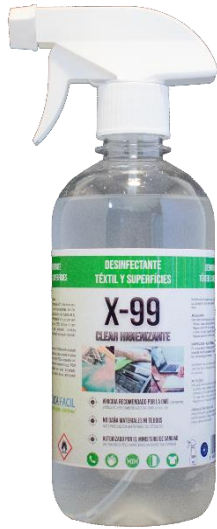
500 ml con PULV