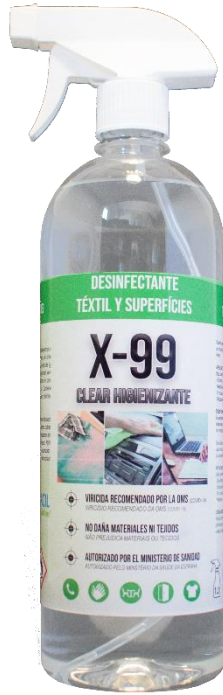
1000 ml con PULV